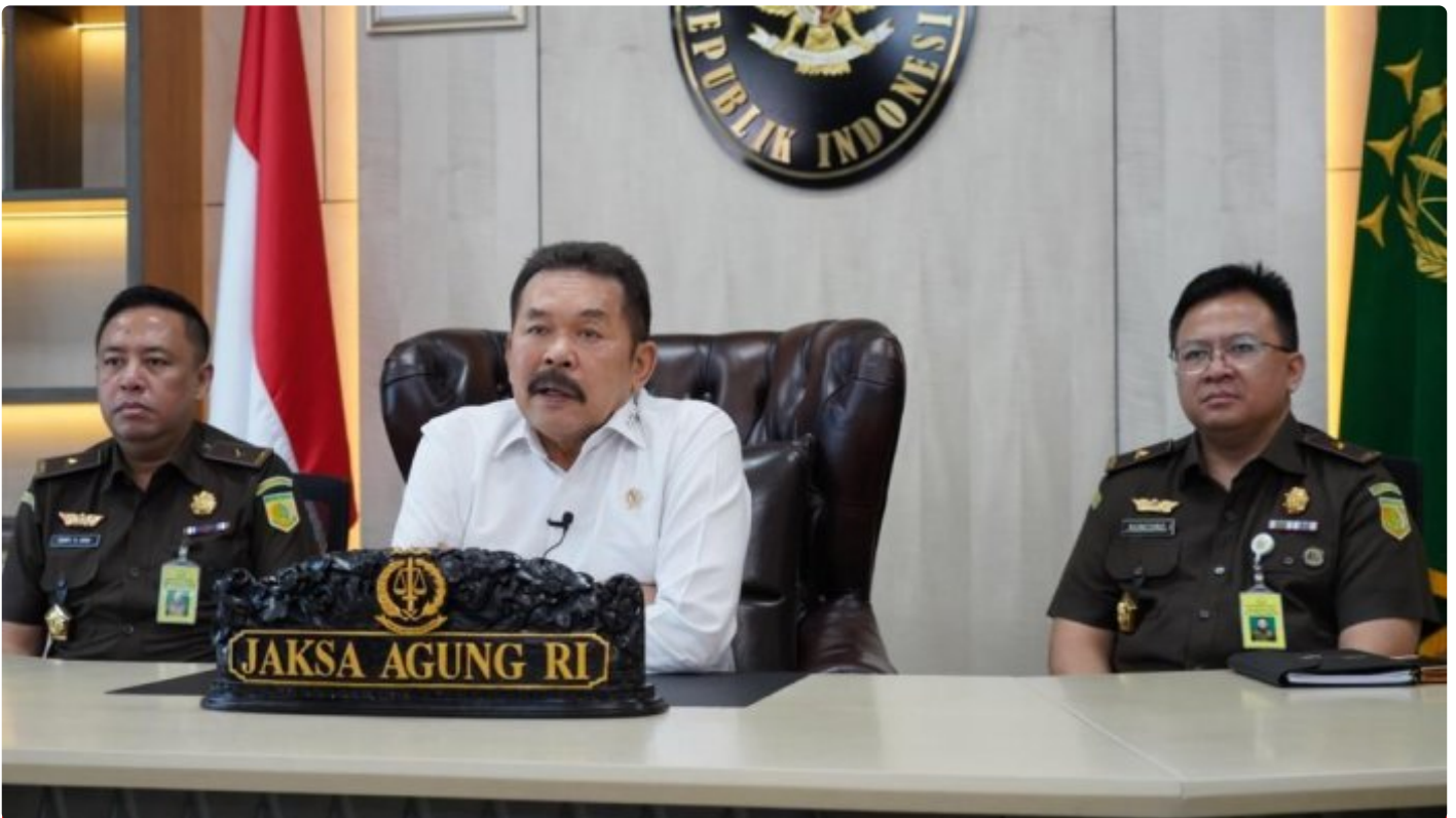
Jaksa Agung, Burhanuddin